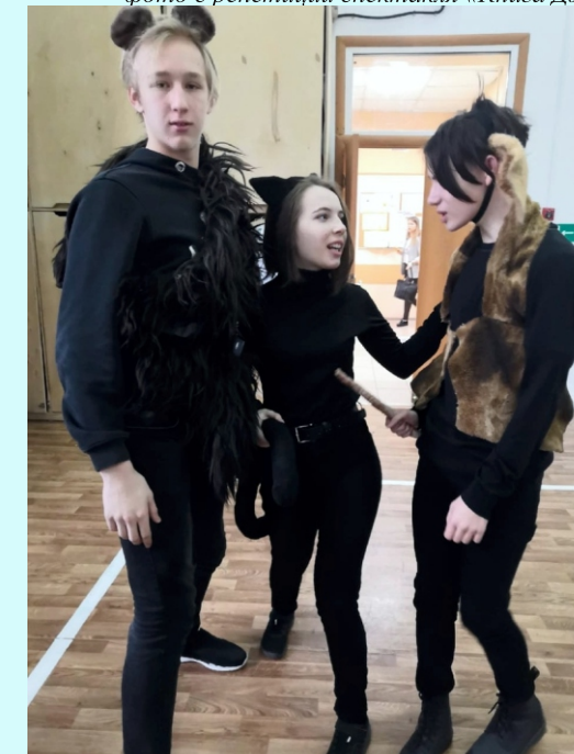
фото с репетиции спектакля «Книга Джунглей»

Особенностью этого мероприятия было то, что ребята рассказывали увлекательные истории на английском языке. Мы узнали интересные сведения из биографии О.Генри. Кроме того, познакомились с его творчеством вживую: учащиеся показали нам миниатюрные театральные выступления. Спасибо десятому классу за увлекательное путешествие по рассказам американского писателя!